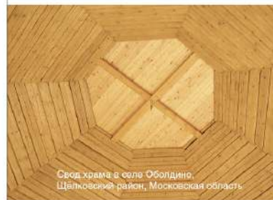
Свод храма в селе Оболдино, Щёлковский район, Московская область

Создавать подобные постройки очень непросто. Все, до мельчайших