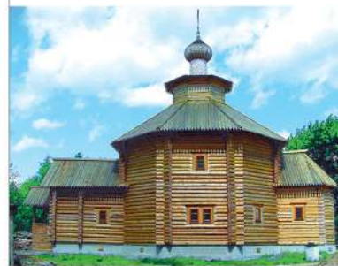
Храм Святого Духа в селе Оболдино, Щёлковский район, Московская область

В старину на Руси из дерева строили все: храмы и часовни, крепости и дворцы, дома и хозяйственные строения, города и села, и вышесказанное определяло облик не только отдельных построек, но и целых поселений. Живописные силуэты зданий, удивительно гармонирующих друг с другом и окружающим ландшафтом, складывались