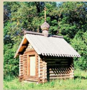
Часовня под Зеленоградом, Московская область