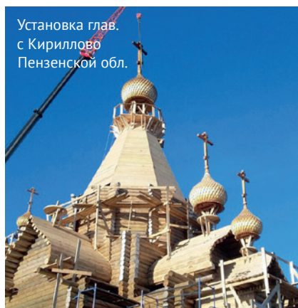
Установка глав. с Кириллово Пензенской обл.

Являясь членом Гильдии храмоздателей, наша мастерская активно